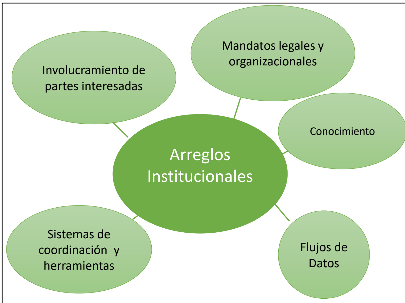
Gráfico 1 Componentes fundamentales de los arreglos institucionales