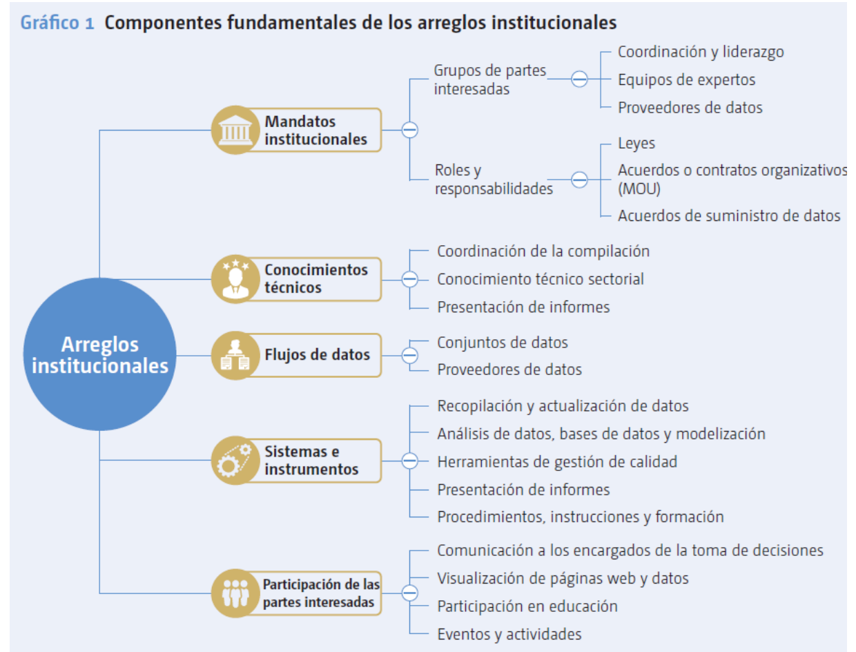
Gráfico 1 Componentes fundamentales de los arreglos institucionales

Apoyo de cambio climático (creación de capacidades, transferencia de tecnología y apoyo financiero)