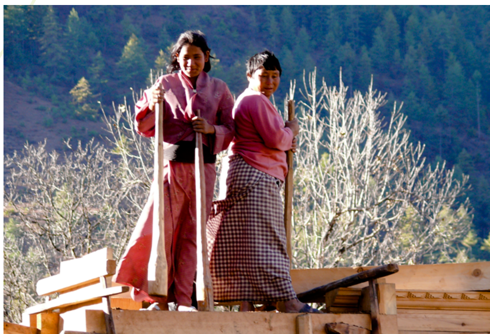
Las mujeres que trabajan, Bhután

La evaluación de género apuntaba a identificar y formar capacidades para potenciar las medidas de mitigación ampliadas (NAMA, LEDS y MRV); integrar las cuestiones de género en la formulación de las políticas sobre el clima; y entregar datos desglosados por género al Gobierno para mejorar la determinación de políticas en esta área.